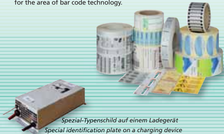
Spezial-Typenschild auf einem Ladegerät Special identification plate on a charging device

SYSTEM PRINT delivers every imaginable type of adhesive label with all kinds of different adhesives, board and plastic tags either blank or printed. Even more – you can also get all hardware components as printing and application systems and all consumables for the area of bar code technology.