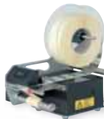
Etikettenspender HES 140 Label dispenser HES 140

The production of customised “special identification plates” is a particular SYSTEM PRINT strong point.